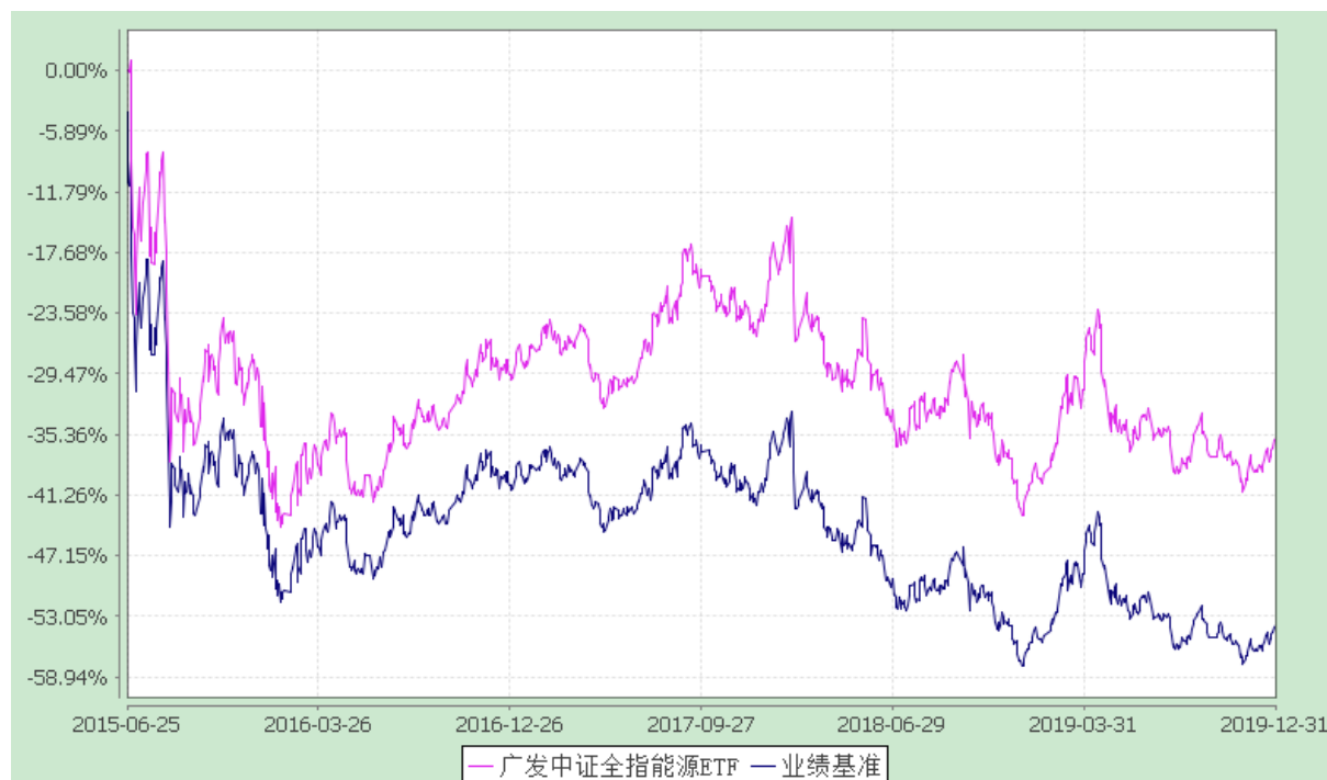
广发中证全指能源交易型开放式指数证券投资基金 份额累计净值增长率与业绩比较基准收益率的历史走势对比图 (2015年6月25日至2019年12月31日)