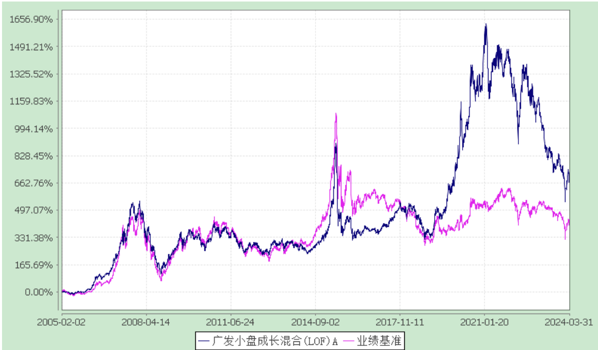
广发小盘成长混合型证券投资基金（LOF） 累计净值增长率与业绩比较基准收益率的历史走势对比图 (2005 年 2 月 2 日至 2024 年 3 月 31 日)